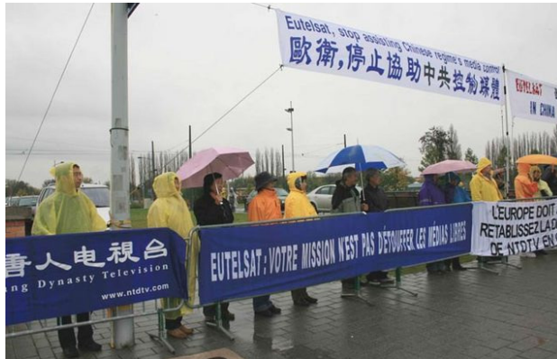
Protest in Straßburg

nach Asien, während der Konferenz der Europäischen Union, wieder übertragen werden. Am 22. Oktober hielten drei Mitglieder des Europa Parlaments und Repräsentanten von NTDTV eine gemeinsame Pressekonferenz ab, riefen die