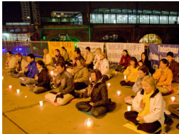
Mahnwache von Falun Gong auf der Jannowitzbrücke in Berlin gegenüber der chinesischen Botschaft.

Künftige Historiker werden klären können, wie es dazu kam, dass die Praktizierenden nicht vor dem Petitionsbüro, ihrem eigentlichen Ziel, aufgestellt wurden, sondern rund um Zhongnanhai, dem hinter Mauern verborgenen Regierungsviertel. Denn so reibungslos, wie diese Umleitung der nach Tausenden zählenden Menge geschah, kann man darauf schließen,