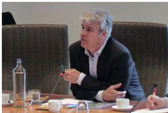
Flämischer Kultur- und Sportminister Bert Anciaux

ein wichtiger Anlass, es ist eine Gelegenheit für uns zu versuchen, den gegenwärtigen Status Chinas zu verbessern und die chinesische Regierung zu drängen, den Zivilrechten des chinesischen Volkes und der Situation in Tibet mehr Aufmerksamkeit zu schenken.“ Er sagte, er sei eine