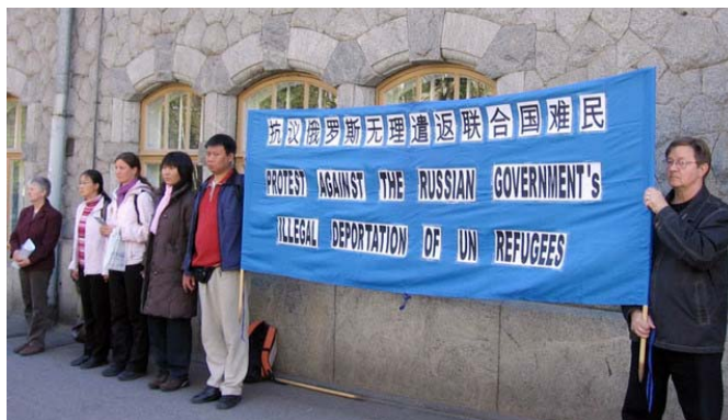
Finnische Praktizierende protestieren vor der russischen Botschaft

Laut des stellvertretenden Direktors der UNHCR hatte der Direktor des russischen Immigrationsbüros erklärt, dass die Deportation von höchster Ebene angeordnet worden war und er diese Anordnung nur ausgeführt hätte.