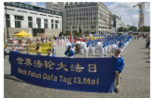
13. Mai Falun Dafa Tag - Übungsdemonstration und Aufstellung zur Parade auf dem Pariser Platz vor dem Brandenburger Tor

Geburtstag des Begründers von Falun Dafa, Li Hongzhi, ist. 250 Praktizierende reisten aus Europa an, da zwei Tage später der EU-China Menschenrechtsdialog stattfand. Darüber hinaus fand den ganzen Tag lang eine Informationsveranstaltung mit Übungsdemonstrationen, Auftritt des Tianguo-Himmelsreichorchesters und verschiedenen Tänzen und Kundgebungen auf dem Pariser Platz vor dem Brandenburger Tor statt. Sonntags sind viele Touristen in dieser Gegend,