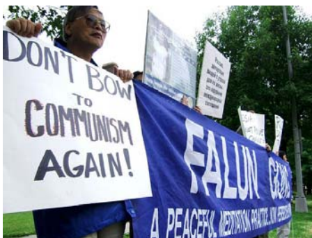
Praktizierende protestieren in Washington DC vor der russischen Botschaft