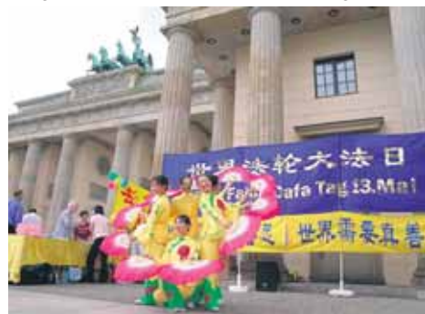
Der chinesische Fächeranzug: Die Feier der Praktizierenden zum siebten „Welt Falun Dafa Tag“ am 13. Mai 2006 in Berlin

Wenn Sie den Newsletter (Printform oder E-Mail) kostenlos zugeschickt bekommen wollen, kontaktieren Sie bitte die Arbeitsgruppe oder rufen Sie an unter 061 63/8281 39.