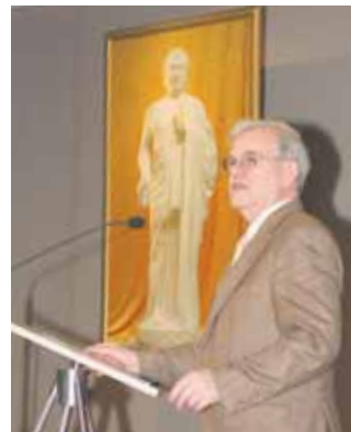
Der Präsident des Sächsischen Landtags, Erich Ilten, hielt die Eröffnungsrede.

ler sind Falun Dafa-Praktizierende. Im Mittelpunkt ihrer Kunstwerke stehen die universellen Prinzipien von „Wahrhaftigkeit, Barmherzigkeit und Nachsicht“ (alle Bilder der Ausstellung findet man online unter www.falunart.org ).