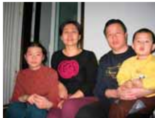
Anwalt Gao Zhisheng mit seiner Familie vor seiner Verhaftung.

Kilgour erwähnt das Beispiel eines Mannes, der zur Transplantation einer Niere nach Schanghai gereist sei. Man habe ihm acht Organe zur Auswahl angeboten. Erst beim achten Versuch habe das Organ „gepasst“. Auf den Einwand, eine Nierenentnahme müsse für den „Spender“ nicht zwangsläufig tödlich enden, entgegnet Kilgour, ihm und seinem Kollegen sei kein einziger Fall zu Ohren gekommen, dass ein „Spender“ den Operationssaal lebend verlassen habe.