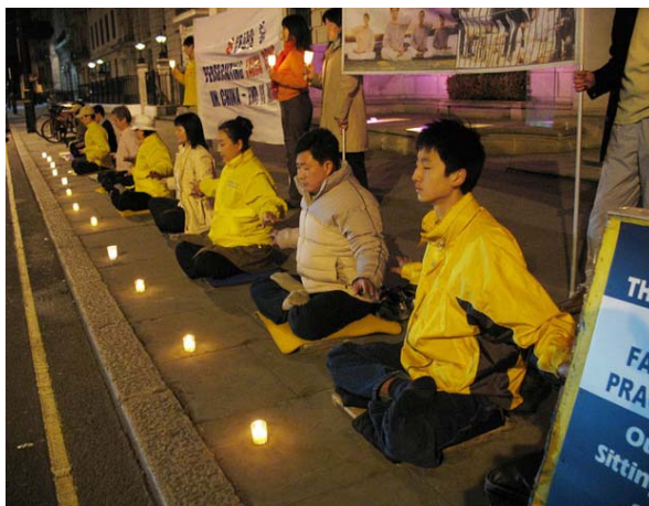
Mahnwache in London

Die Verfolgung in China umfasst alle Lebensbereiche: sie führt zum Verlust von Arbeitsplatz und Wohnung, schließt Schüler und Studenten von der Ausbildung aus, zwingt Frauen zur Abtreibung und Ehepaare zur Scheidung. Seit dem Beginn der Verfolgung im Juli 1999 wurden Hunderttausende Praktizierende in Gefängnisse und Arbeitslager gesteckt. Es liegen Informationen von mehr als 3025 Todesfällen vor, zu denen es durch Folter in Polizeistationen und Arbeitsla-