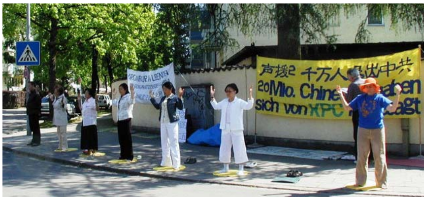
Proteste vor dem chinesischen Konsulat in München

Diese Erkenntnis verstärken bei der chinesischen Bevölkerung auch die Proteste, Kundgebungen und Mahnwachen vor den chinesischen Botschaften und Konsulaten, mit denen Falun Gong Praktizierende am achten Jahrestag dieses Appells, europaweit der in China durch die Verfolgung getöteten Praktizierenden gedachten und ein Ende der Verfolgung fordern.