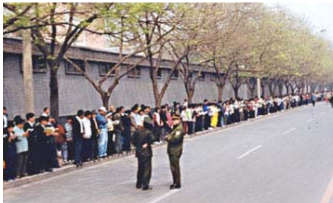
Falun Gong Praktizierende beim Appell am 25. April 1999

Anfang 1999 hieß es in einem offiziellen Bericht, dass über 70 Millionen chinesischer Bürger, einschließlich Mitgliedern der Kommunistischen Partei, ho-